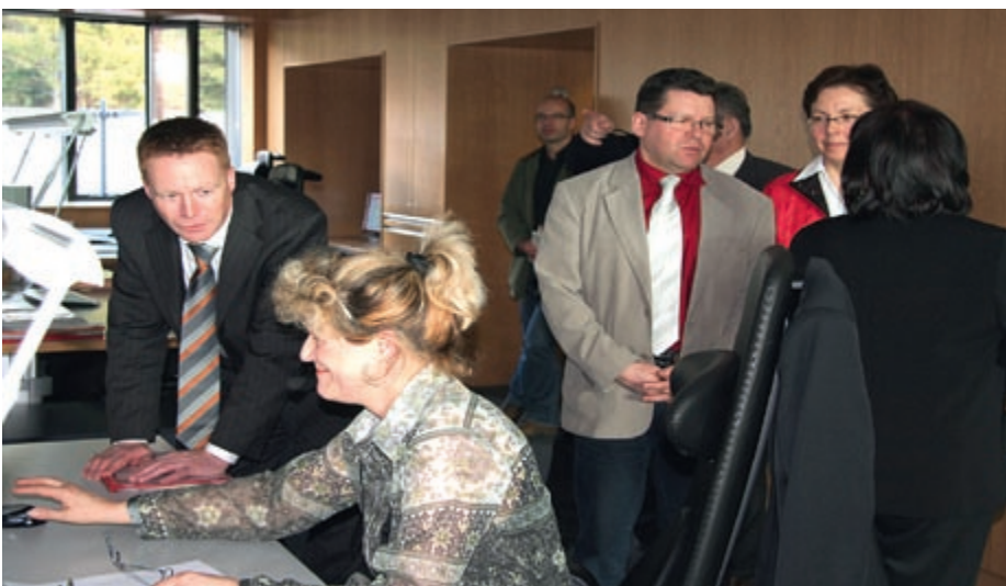
Innere Sicherheit ist ein wichtiges Politikfeld. Bereits vor zwei Jahren besuchten Abgeordnete der SPD-Fraktion deshalb die hochmoderne Rettungsleitstelle in Suhl.