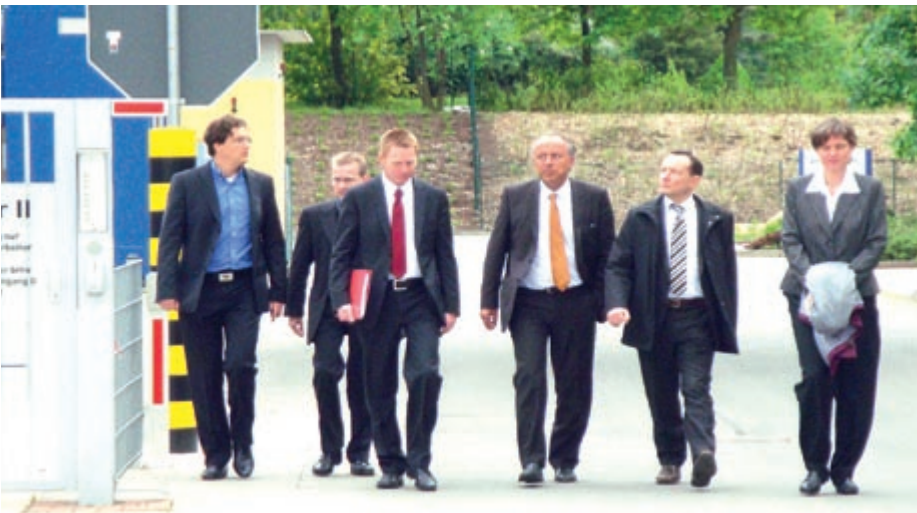
Matthias Machnig, Staatssekretär im Bundesumweltministerium (Bildmitte), besuchte Anfang Mai Erfurt. Gemeinsam mit Christoph Matschie (links neben Machnig) und Erfurter Unternehmern diskutierten er über Energiepolitik und Ökologie. Zum Besuchsprogramm gehörten Besuche bei den Firmen Ersol und PV Silikon.