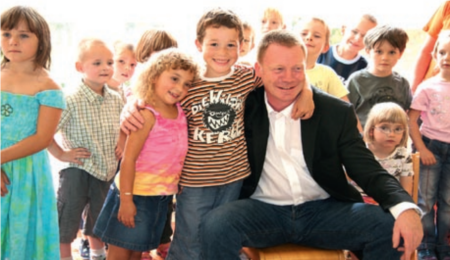
Kindergärten besucht Christoph Matschie regelmäßig. Er mag Kinder und setzt sich mit der SPD-Fraktion seit langem für Verbesserungen in den Thüringer Kitas ein. 2000 Erzieherinnen fehlen in den Einrichtungen - die SPD-Fraktion machte deshalb Druck bei der Landesregierung.