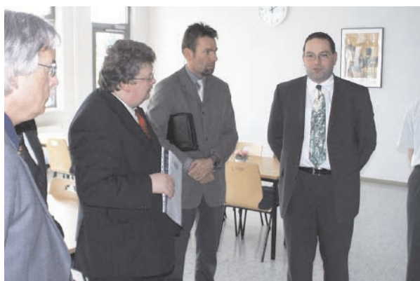
Auf großes Interesse bei den Mitgliedern der SPD-Fraktion stieß die Besichtigung der Firma "Blue Chip" bei Altenburg.